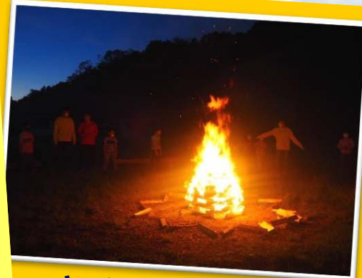
キャンプファイヤー